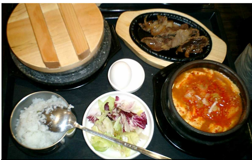
写真 4. 海鮮スンドゥブ

さらに読み進めると「BSD とは？」「BSD で使われている豆腐について」という題目があり思わずニヤリとしてしまうのは私だけではあるまい。さらに一品メニューに目を移すと「BSD キムチ」「BSD サラダ」「BSD 石釜ライス」と BSD はこんなにあつたのか、と錯覚するほどの